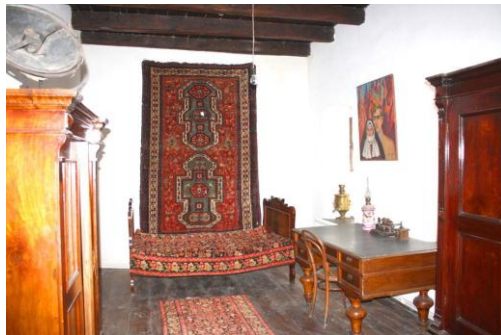
Ակսել Բակունցի տուն-թանգարանը

1. Երբևէ եղե՞լ ես Ակսել Բակունցի ծննդավայրում, ինչի՞ն ես նմանեցնում Գորիսի համայնապատկերը, ի՞նչ զգացողություններ է այն առաջացնում քո մեջ: