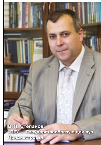
В.П. Степанов: «ПГУ – Государствообразующий вуз Приднестровья»