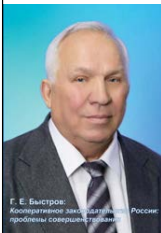
Г.Е. Быстров: Кооперативное законодательство России: проблемы совершенствования