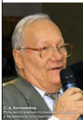
С.А. Боголюбов: Роль экологических положений Конституции в евразийском пространстве