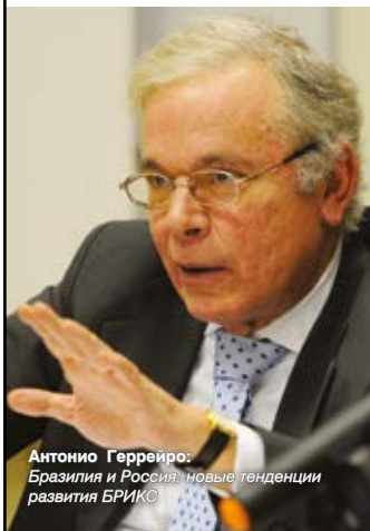
Антонио Гутеррейро: Бразилия и Россия: новые тенденции развития БРИКС