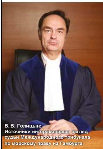
В.В. Голицын: Источники интерэкспорта: взгляд судьи Международного трибунала по морскому праву из Гамбурга