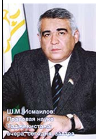
Ш.М. Исмаилов: Правовая наука Таджикистана: вчера, сегодня, завтра