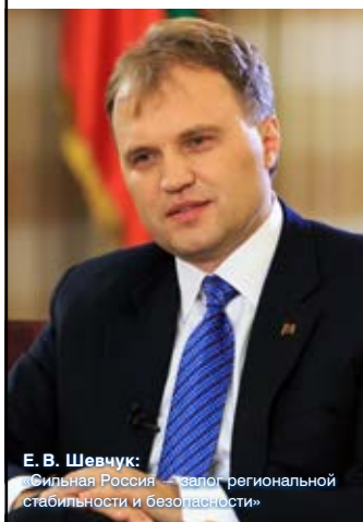
Е.В. Шевчук: «Сильная Россия – залог региональной стабильности и безопасности»