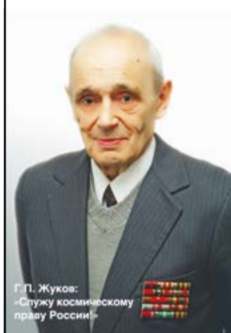
Г.П. Жуков: «Служу космическому праву России!»