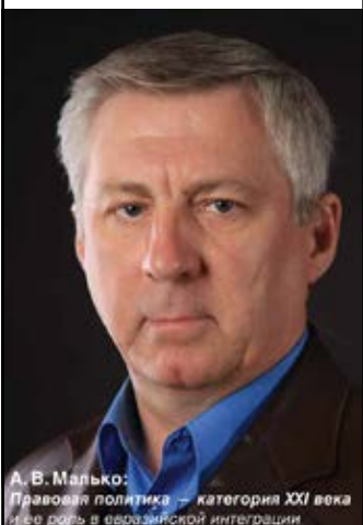
А.В. Малько: Правовая политика – категория XXI века и ее роль в евразийской интеграции