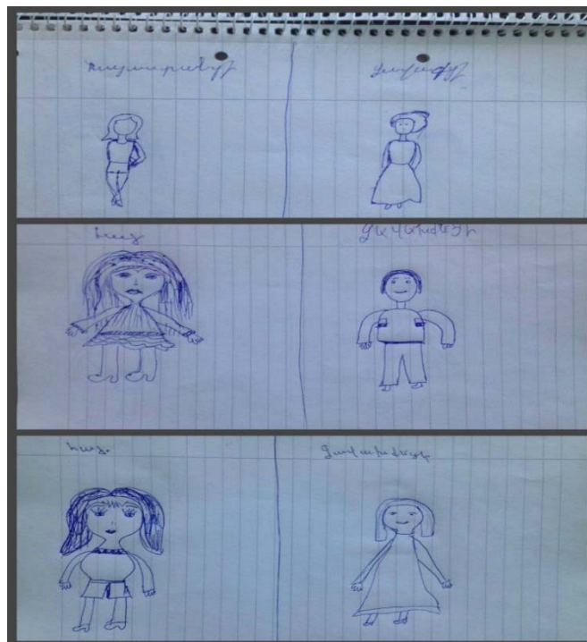
Նկար 1. Հայաստանցու և ջավախքեցու կերպարային ընկալումները

Հայաստանցուն «մեզնից լիովին տարբեր» ընկալելու հանգամանքը երևաց նաև նկարներում: Հայաստանցիներին աղջկա կերպարով էին նկարում, արդի տարրերի համադրությամբ, մինչդեռ ջավախքեցու կերպարը կա՛մ տղամարդ էր՝ առանց վառ արտահայտված որևէ տարրի, կամ էլ աղջիկ կամ կին՝ բավականին համեստ կերպարով, ավանդական տարրերի առկայությամբ, հաճախ՝ տարազանման հագուստով (Նկար 1):