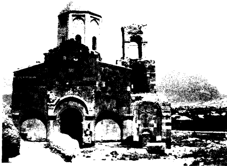
Церковь Св. Карапета в Абракунисе (Нахиджеван) в 1987 г. до ее уничтожения в 2004 г.